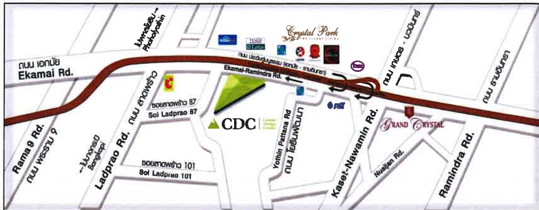
แผนที่อาคาร ของ คริสตัส ดีไซน์ เซ็นเตอร์