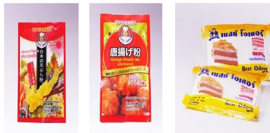
แป้งเทมประ

สูตรมาตรฐาน ภายใต้ตราสินค้า ได้แก่ “อังเคิลบาร์นส์” เพื่อจำหน่ายให้กับธุรกิจค้าปลีกขนาดใหญ่และร้านค้าปลีกทั่วไป และ “super-find” เพื่อจำหน่ายให้กับร้านค้าปลีกทั่วไป ขนาดของบรรจุภัณฑ์ที่จำหน่ายให้กับผู้ประกอบการจะเป็นบรรจุภัณฑ์ขนาด 10 และ 25 กิโลกรัม ส่วนบรรจุภัณฑ์ที่จำหน่ายให้กับธุรกิจค้าปลีกขนาดใหญ่และร้านค้าปลีกทั่วไป มีขนาดตั้งแต่ 150 กรัม ไปจนถึง 1 กิโลกรัม สำหรับผลิตภัณฑ์กลุ่ม Premix product ยังรวมถึงการผลิตผงฟู ซึ่งผลิตและจำหน่ายโดย RBF (สูตรดับเบิ้ลแอนด์ดิง) และ BO (สูตรซิงเกิ้ลแอนด์ดิง) ซึ่งบริษัทและบริษัทย่อยทั้งสองจะผลิตผงฟูต่างสูตรกันตามใบอนุญาตการผลิต เพื่อจำหน่ายผงฟูให้กับธุรกิจค้าปลีกขนาดใหญ่ ร้านค้าปลีกทั่วไป และร้านเบเกอรี่ต่างๆ ภายใต้ตราสินค้า ได้แก่ “เบสท์โอเดอร” มีขนาดบรรจุภัณฑ์ขนาดตั้งแต่ 30 กรัม ไปจนถึง 17 กิโลกรัม ผลิตภัณฑ์ Premix product นอกจากจำหน่ายภายในประเทศแล้ว บริษัทและบริษัทย่อยยังส่งออก Premix product ไปยังต่างประเทศด้วย อาทิ อินโดนีเซีย บาเรน บังคลาเทศ จีน ไชปรัส อินเดีย อียิปต์ เมียนมาร์ รัสเซีย ซาอุดีอาระเบีย สหรัฐอาหรับเอมิเรต เป็นต้น