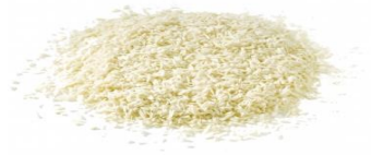
เกล็ดขนมปังแบบญี่ปุ่น

ไปจำหน่ายยังต่างประเทศ อาทิ เวียดนาม อินโดนีเซีย มาเลเซีย เนปาล อินเดีย อียิปต์ รัสเซีย เยอรมัน เนเธอร์แลนด์ ออสเตรเลีย บาเรน บังคลาเทศ จีน ไชปรัส เกาหลีใต้ คูเวต ลิทัวเนีย เมียนมาร์ นิวซีแลนด์ ปากีสถาน ฟิลิปปินส์ โปแลนด์ รัสเซีย ซาอุดีอาระเบีย อเมริกาใต้ สิงคโปร์ สหรัฐอาหรับเอมิเรต สหราชอาณาจักร เป็นต้น