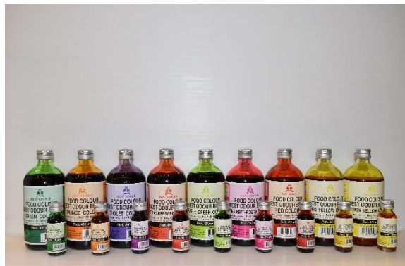
วัตถุแต่งกลิ่นและรสเลียนธรรมชาติ ตราเบสท์ โอเดอร์

นอกจากนี้ บริษัทและบริษัทย่อยยังผลิตวัตถุแต่งกลิ่นและรสที่มีขนาดบรรจุภัณฑ์ขนาดเล็กที่ใช้ในอุตสาหกรรมครัวเรือน โรงแรม ร้านอาหาร เพื่อจำหน่ายให้กับธุรกิจค้าปลีกขนาดใหญ่และร้านค้าปลีกทั่วไป ภายใต้ตราสินค้า “เบสท์ โอเดอร์” ส่งออกไปจำหน่ายยังประเทศกัมพูชา เวียดนาม และเมียนมาร์ สำหรับขนาดบรรจุภัณฑ์ที่จำหน่ายให้กับผู้ประกอบการจะเป็นขนาดใหญ่ 5 – 25 กิโลกรัม ส่วนขนาดบรรจุภัณฑ์ที่จำหน่ายให้กับธุรกิจค้าปลีกขนาดใหญ่และร้านค้าปลีกทั่วไปจะเป็นขนาดเล็ก 30 – 60 มิลลิลิตร