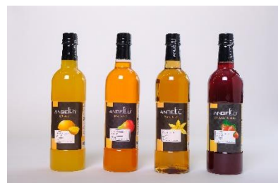
Syrup กลิ่นต่างๆ ตรา Angelo และตรา Haeyo