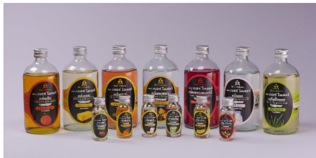
สีผสมอาหาร ตราเบสท์ โอเดอร

นอกจากสีผสมอาหารของกลุ่มบริษัทจะจำหน่ายให้กับผู้ประกอบการในอุตสาหกรรมต่างๆ ข้างต้นแล้ว บริษัทยังจำหน่ายสีผสมอาหารให้กับธุรกิจค้าปลีกขนาดใหญ่ และร้านค้าปลีกทั่วไป ภายใต้ตราสินค้า “เบสท์ โอเดอร” และส่งออกไปจำหน่ายยังประเทศกัมพูชา เวียดนาม และเมียนมาร์ โดยสีผสมอาหารจะจำหน่ายให้กับธุรกิจค้าปลีกขนาดใหญ่และร้านค้าปลีกทั่วไปทั้งจำหน่ายภายในประเทศและต่างประเทศมีทั้งชนิดสีผงและสีน้ำ ซึ่งสีผสมอาหารชนิดผงมีจำหน่ายเป็นซองขนาดบรรจุ 1 กรัม และ 2 กรัม และจำหน่ายเป็นกระป๋องขนาดบรรจุ 500 กรัม และ 1 กิโลกรัม ส่วนสีผสมอาหารชนิดน้ำมีจำหน่ายในขวดขนาดบรรจุ 30 มิลลิลิตร 60 มิลลิลิตร และ 450 มิลลิลิตร