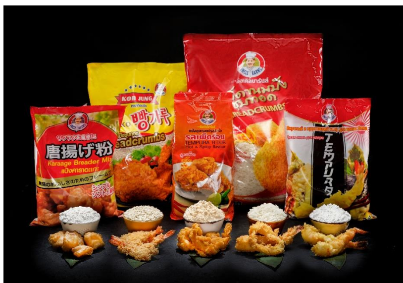
แป้งและเกล็ดขนมปัง ตรารังเคิลบาร์นส์

- TFF จำหน่ายผลิตภัณฑ์กลุ่มแป้งและซอส เพื่อเป็นการอำนวยความสะดวกให้กับลูกค้าของ TFF