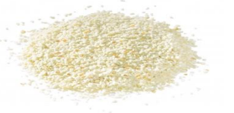
เกล็ดขนมปังแบบอเมริกัน