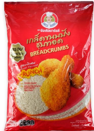
เกล็ดขนมปังตราอังกะเคิลบาร์นส์